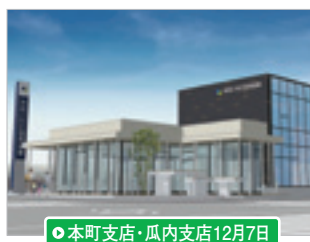
●本町支店・瓜内支店12月7日