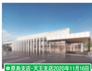
●原島支店・天王支店2020年11月16日