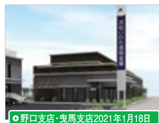
●野口支店・曳馬支店2021年1月18日