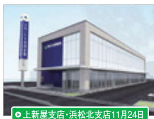
●上新屋支店・浜松北支店11月24日