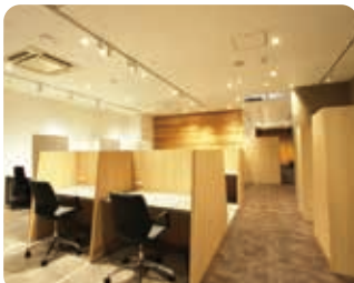
フォーカスブース