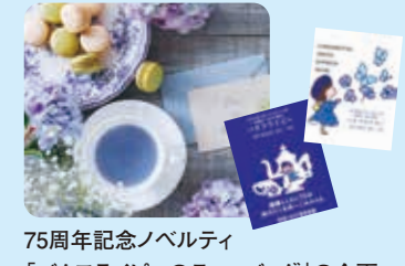
75周年記念ノベルティ 「バタフライビーのティーバッグ」の企画