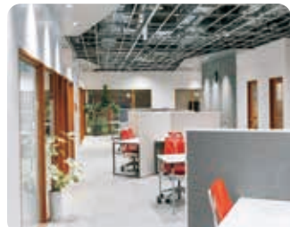
ワーキングスペース