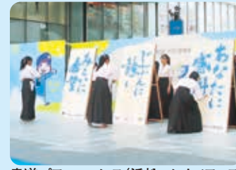
書道パフォーマンス(浜松エンタメフェス)

次世代を担う高校生は、かけがえない地域の財産です。 協働を深めることで、人材育成と地域経済の発展につなげていきます。