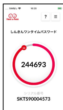
(ライトモードの例)