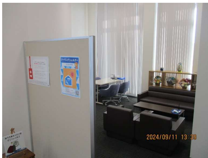
袋井中央支店・久能支店