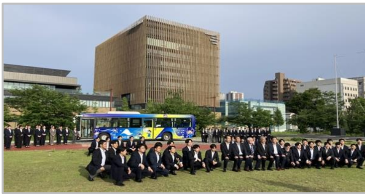
（2025年5月28日（水） 当金庫役員と今年度新入職員 75 名等参加による記念撮影の様子）