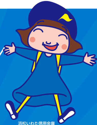
浜松いわた信用金庫 イメージキャラクター

この度、浜松いわた信用金庫は、菊川市、御前崎市、牧之原市、吉田町および近隣の皆さまのお役に立てるよう地域密着型店舗として、「菊川支店」をグランドオープン致します。菊川市には初めての出店となりますが、総合的な金融サービスを提供するフルバンキング機能の店舗として、地域の皆さまにご満足いただける店舗を目指してまいりますので、よろしくお願い申し上げます。